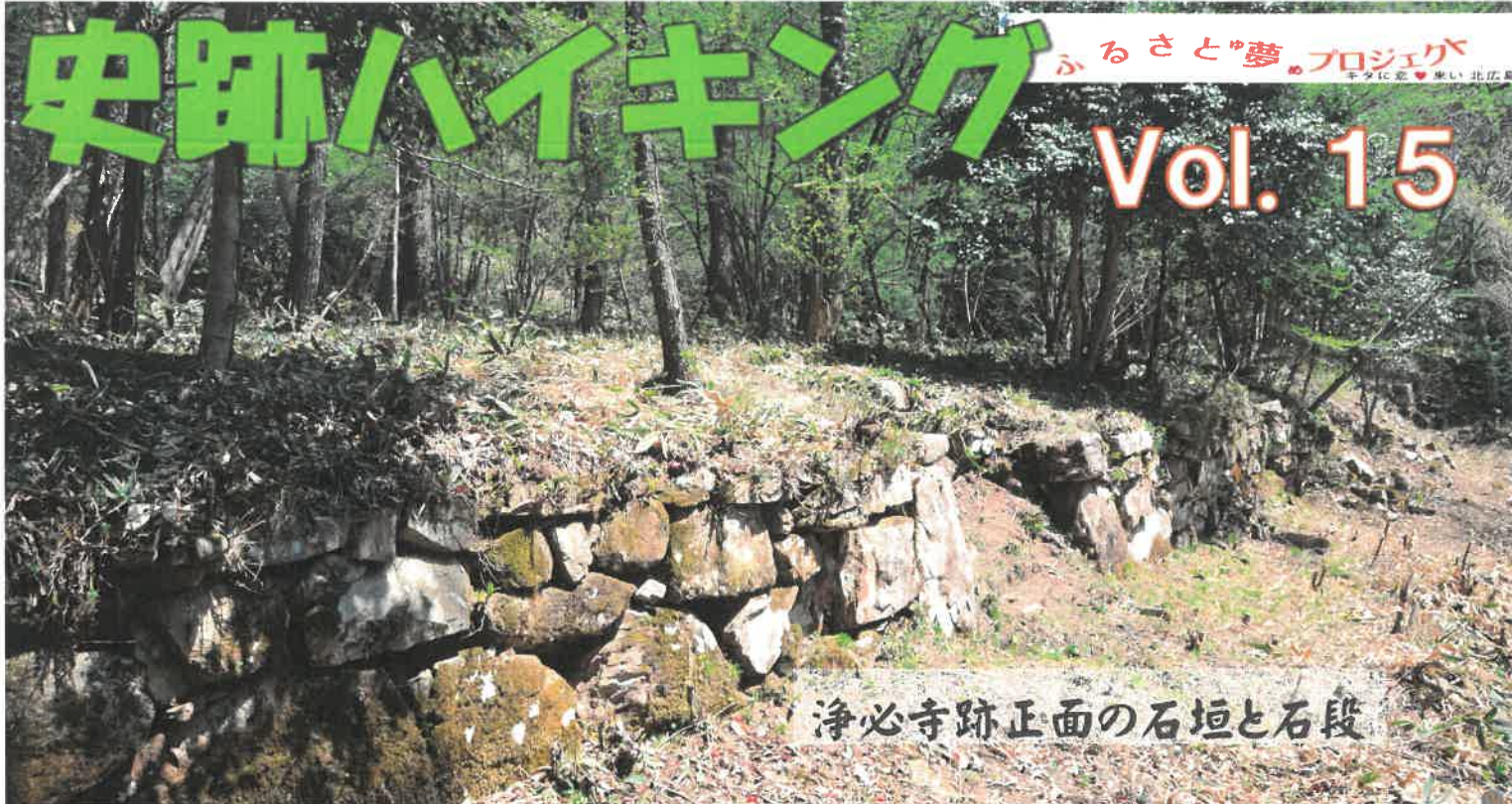
浄必寺跡正面の石垣と石段