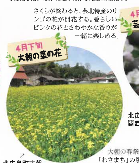
4月下旬 大朝の菜の花

県道11号線沿い、橋山大歳神社の境内に咲く。神社の社殿とあわせて里山のしっとりとした風情が趣き深い。