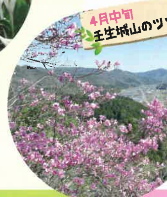
4月中旬 壬生城山のツツジ

北広島町川小田(緑の広場) ☎080-6339-2136 (北広島町観光協会芸北支部)