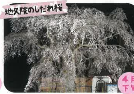
地久院のしだれ桜