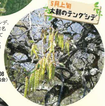
5月上旬 大朝のテングシデ

天然記念物のテングシデ、新緑や冠雪の姿は有名だが、意外と知られていないのがその花で、新緑の前の満開時が見頃。是非一度、訪れてみたい。