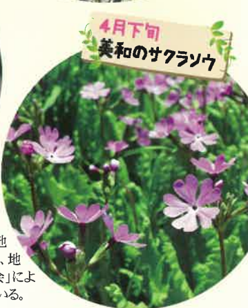
4月下旬 美和のサクラソウ

美和のサクラソウは、他の地域にはない自生の品種で、地元の「サクラソウを育てる会」によって大切に守り育てられている。