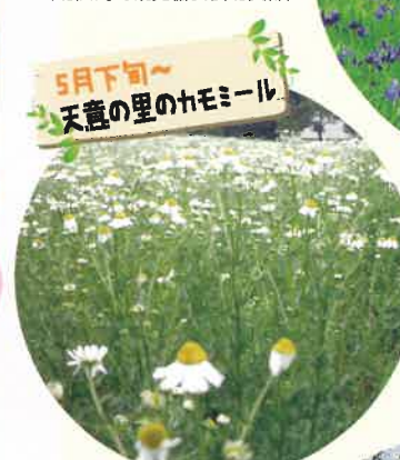
5月下旬~ 天意の里のハモミール