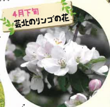
4月下旬 芸北のリンゴの花