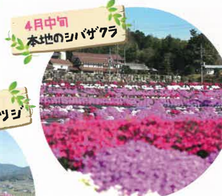
4月中旬 本地のシバザクラ