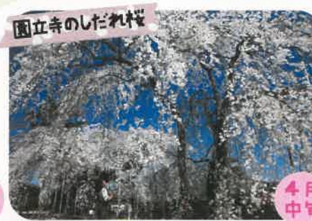
園立寺のしだれ桜