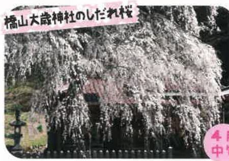
橋山大歳神社のしだれ桜

推定樹齢約420年、一度倒伏したものを村人の力で復旧した。豊かに盛りあがった樹型は見事。