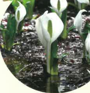
4月中旬 芸北の水芭蕉

ツツジの名所として知られる壬生城山は公園として整備されており、徒歩で気軽に登れる。「つつじ祭り」も開催される。